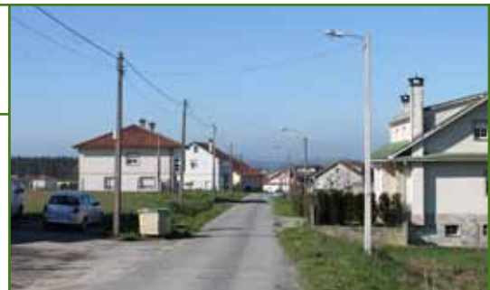
Imaxe da zona, onde se mellorará o alumado e a seguridade viaria