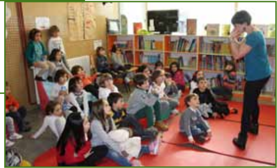
Día Internacional do Libro Infantil

O Concello de Oroso ten preparado un programa especial para conmemorar o Día das Letras Galegas, que inclúe concursos, exposicións, contacontos e obradoiros. A biblioteca de Sigüeiro será o epicentro das actividades e nela haberá unha mostra sobre Xosé María Díaz Castro, homenaxeado este ano. Así mesmo, xa está convocada a décima edición do Concurso de Marcapáxinas , cuxos premios serán entregados o 14 de maio, e que poderán visitarse na biblioteca. Ademais, o 14 de maio, ás 18:00 h., Elefante Elegante ofrecerá unha sesión especial de contacontos chamada "O aviador" . E o mércores 16 de maio, tamén ás 18:00 h., Viravolta Títeres ofrecerá o obradoiro "Marionetas de papel" . E ollo aos cambios no programa de animación á lectura por mor da Festa da Troita e do Día das Letras Galegas. Só haberá dous contacontos os sábados (o 3 e o 24) baixo a temática "Contos vellos para rapaces novos". O clube de lectura reunirase o venres 23 de maio, ás 18:00 h. E haberá dúas sesións especiais: un obradoiro co gallo da Festa da Troita (10 de maio, ás 11:30 h.) e unha gran festa de despedida desta temporada (30 de maio, ás 18 h.). En todos os casos a participación é de balde pero hai que anotarse na biblioteca ou no 981 690 903.