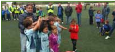
Os prebenxamíns da ED Xuventude Oroso revalidaron o seu título