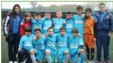
Os alevíns da ED Xuventude, campións de Liga