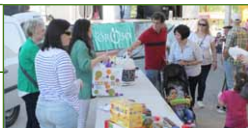
Os Servizos Sociais de Oroso recolleron máis de 1.500 kg de alimentos e produtos de hixiene

Dende o Concello de Oroso queremos darvos as nosas máis expresivas grazas a todos os que fixéchedes posible o éxito da I Gala da Solidariedade : máis de 1.500 quilos de alimentos e produtos de hixiene. E grazas tamén a todos os artistas, entidades, empresas e asociacións que colaboráchedes desinteresadamente.