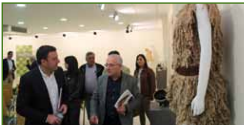
A inauguración contou coa participación do presidente da Deputación da Coruña