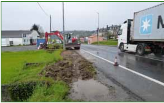
Instalarse unha baranda de seguridade ata rotonda