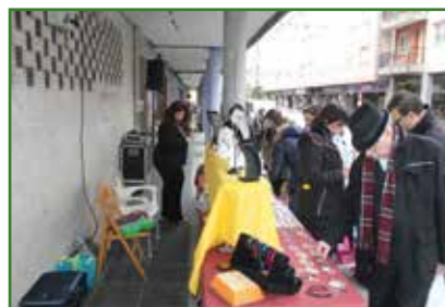
Gran estreo para Mercado de Artesanía