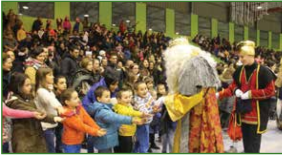
O Pavillón non abrirá ata pasadas as 18.30 horas