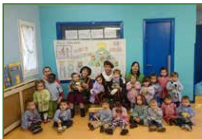
Paxe e Carteiro Reais recolleron as cartas nas garderías, CRA e residencia de maiores