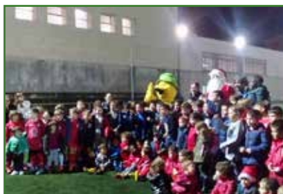
Papá Noel e Troi coa ED Xuventude