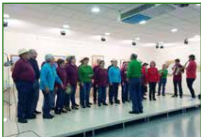
O festival de panxoliñas consolídase como unha das citas máis concorridas e os grupos ofrecen actuacións de gran nivel