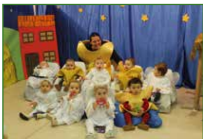
O Belén Vivente da Gardería Municipal da Ulloa volveu dar o pistoletazo de saída ao Programa de Nadal do Concello de Oroso