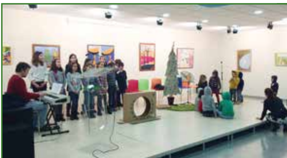
Actuación da Escola de Música no Festival de Panxoliñas

O importe total do curso é de 250 euros, que se poden aboar todos xuntos ou en catro prazos. As inscricións poden realizarse no centro cultural de Sigüeiro e os únicos requisitos son ter máis de 18 anos e, como mínimo, os estudos de Graduado en ESO. As prazas son limitadas, polo que serán outorgadas por orde de inscrición, tendo preferencia as persoas empadroadas no Concello de Oroso. O curso está estruturado en seis partes, comezando cun área de piscosocioloxía e lexislación para pasar a unha área de animación e xogos: xogos de interior e aire libre, dinámicas de animación, grandes xogos, animación deportiva... O alumnado tamén recibirá formación en primeiros auxilios, técnicas de acampada e xogos de educación ambiental e natureza.