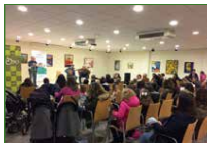
Concerto "Cantarolas para xente miuda"