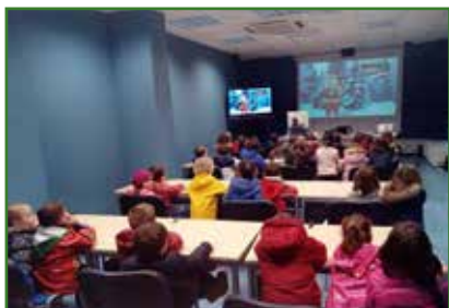
Videokonferencia con Papá Noel