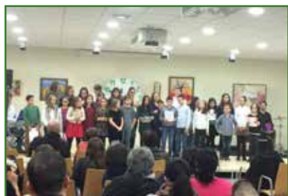
Gran éxito de participación no Concerto de Nadal da Aula de Música de Oroso