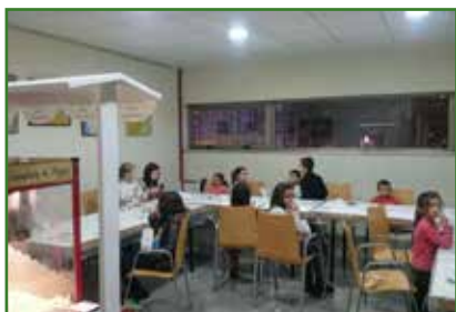
Un dos obradoiros de Nadal