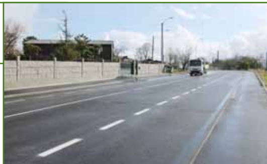
En Senra tan só falta que Unión Fenosa subministre a electricidade precisa para o novo alumeadado público

Quen dixo aquilo de que máis vale tarde ca nunca semella que estivese ollando a marcha das obras de construción das beirarrúas de Senra, que hoxe xa son unha realidade despois de case 4 anos de traballos por parte do Concello e máis de 2 anos dos veciños e veciñas da zona aturando as molestias dunhas obras inacabadas. A falta de que Fenosa subministre a enerxía para poñer a funcionar o novo alumeadado, os 1,6 quilómetros de beirarrúas da estrada DP-38011 Sigüeiro-San Mauro xa están definitivamente rematados coa súa correspondente recollida de pluviais e fecais, así como co cableado do alumeadado público soterrado.