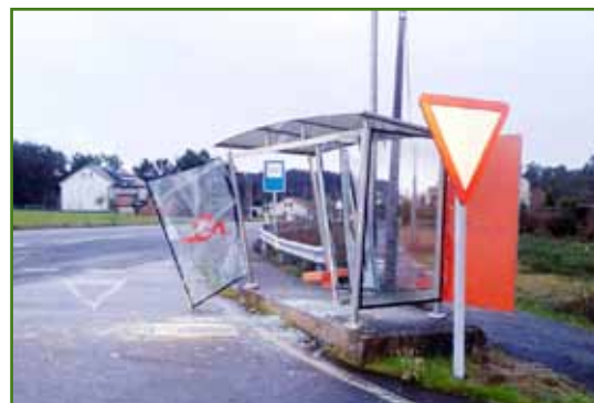
Voluntarios de Protección Civil e traballadores do Concello deron rápida resposta ás distintas incidencias