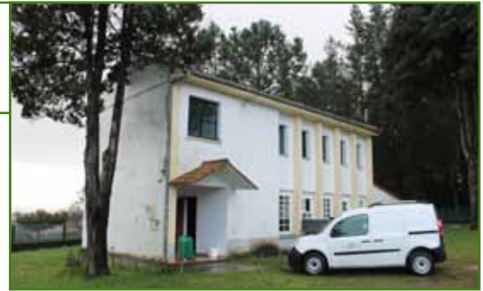
As actuacións de mellora céntranse no interior da segunda planta do inmoble