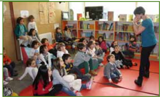
Día Internacional do Libro Infantil

O Concello de Oroso ten preparado un programa especial para conmemorar o Día das Letras Galegas, que inclúe concursos, exposicións, contacontos e obradoiros. A biblioteca de Sigüeiro será o epicentro das actividades e nela haberá unha mostra sobre Xosé María Díaz Castro, homenaxeado este ano. Así mesmo, xa está convocada a décima edición do Concurso de Marcapáxinas , cuxos premios serán entregados o 14 de maio, e que poderán visitarse na biblioteca. Ademais, o 14 de maio, ás 18:00 h., Elefante Elegante ofrecerá unha sesión especial de contacontos chamada "O aviador" . E o mércores 16 de maio, tamén ás 18:00 h., Viravolta Títeres ofrecerá o obradoiro "Marionetas de papel" . E ollo aos cambios no programa de animación á lectura por mor da Festa da Troita e do Día das Letras Galegas. Só haberá dous contacontos os sábados (o 3 e o 24) baixo a temática "Contos vellos para rapaces novos". O clube de lectura reunirase o venres 23 de maio, ás 18:00 h. E haberá dúas sesións especiais: un obradoiro co gallo da Festa da Troita (10 de maio, ás 11:30 h.) e unha gran festa de despedida desta temporada (30 de maio, ás 18 h.). En todos os casos a participación é de balde pero hai que anotarse na biblioteca ou no 981 690 903.