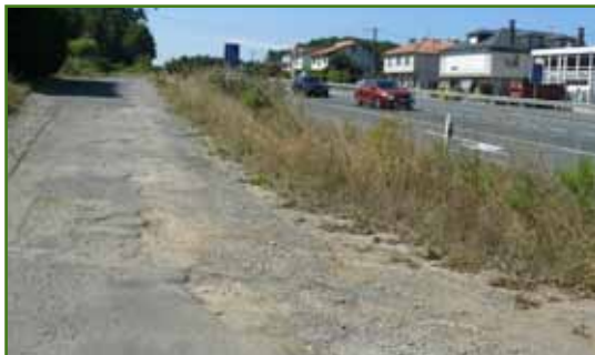
Fomento ten os viais paralelos da N-550 nun estado terciomundista