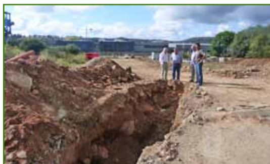
O Concello e a Xunta de Compensación Urbanística da Área de Reparto Nº 1 están a executar as obras de urbanización en tempo récord

Pese a estes últimos atrancos, o Concello de Oroso cumpríu puntualmente cos seus compromisos para que o colexio poda abrir as súas portas. Agora centrarase en mellorar os accesos ao centro, entre os que se inclúe unha senda peonil dende a rúa do Portiño que comunicará coa gardería da Ulloa e as beirarrúas da N-550. Xusto enfronte, acometerá unhas beirarrúas dende os talleres ata a chegada ao centro escolar. O Ministerio de Fomento será quen decida onde se coloca o novo paso de peóns para os rapaces que veñan da outra marxe da N-550.