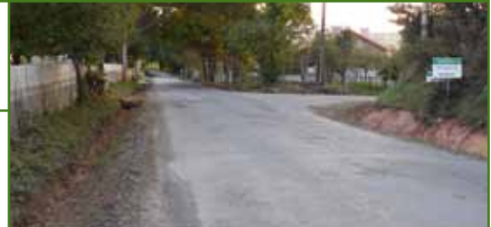
Actuacións de mellora na estrada que une Marzoa e Deixebre

O Concello de Oroso vén de iniciar os traballos de mellora da estrada que comunica as parroquias de Marzoa e Deixebre. Unha estrada onde xa realizou traballos de limpeza de cunetas. Agora o Concello procederá a anchar algúns tramos para incrementar a seguridade viaria dos condutores así como a mellorar a súa capa de rodadura con aglomerado asfáltico.