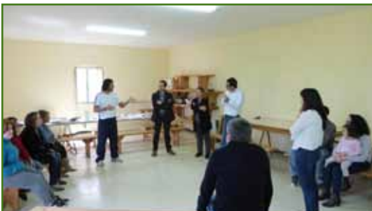
A escola será un punto de encontro onde familias e educadores intercambiarán experiencias sobre a educación dos cativos

Asimesmo, compre lembrar que entre o 4 e o 24 de xullo estará aberto o prazo para anotarse nas dúas quendas de agosto do Verán Lúdico , o programa de conciliación familiar posto en marcha polo Concello de Oroso para as mañás dos meses de verán. Neste mes de xullo participan unha vintena de rapaces. O Concello establece descontos para empadroados, familias numerosas e para os que teñan un segundo irmán na actividade.