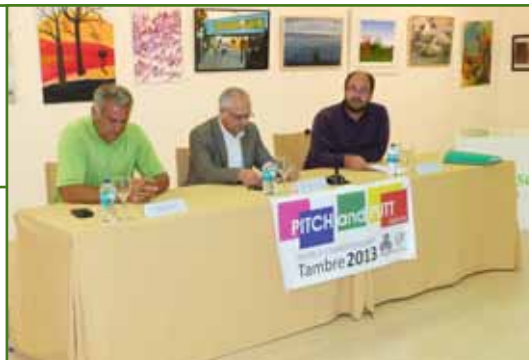
Presentación oficial do Campionato do Mundo Pitch & Putt que terá lugar en Oroso do 4 ao 7 de xullo

Un total de 108 xogadores de catorce países participarán no segundo Campionato do Mundo de Pitch & Putt , que se celebrará en Oroso do 4 ao 7 de xullo de 2013 organizado pola Federación Internacional de Pitch & Putt (FIPPA) e a Asociación Galega de Pitch & Putt (ASGAPP). Un evento que se disputará nas instalacións de Tambre Pitch & Putt na Gándara e que conta coa colaboración do Concello de Oroso.