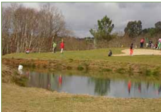
Disputarán a competición os 108 mellores xogadores do mundo