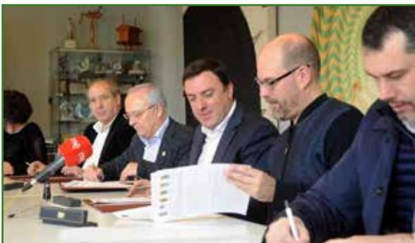
A Deputación achegará 32.000 euros, o 80% do custe do proxecto. O resto será asumido polos concellos

A día de hoxe, en "Oroso Verde" poden depositarse diversos residuos para a súa clasificación, separación e posterior reciclaxe: pilas, disolventes, electrodomésticos, aerosois, baterías, produtos de informática... nos catro contedores dispostos nas instalacións: papel e cartón, vidro, envases e téxtil. O Concello de Oroso habilitou tamén un lugar especial para a recollida de plásticos agrícolas e entullos de obra, de uso exclusivo para particulares. O quinto contedor, para a recollida de materia orgánica e obrigatorio a partir de 2020, instalárase a finais de 2018 se ben "tanto nos restaurantes como nos comedores públicos nos colexios imos empezar xa a recoller a materia orgánica porque imos poñer en marcha a compostadora industrial que acabamos de adquirir e que está emprazada no propio punto de reciclaxe", adianta o alcalde.